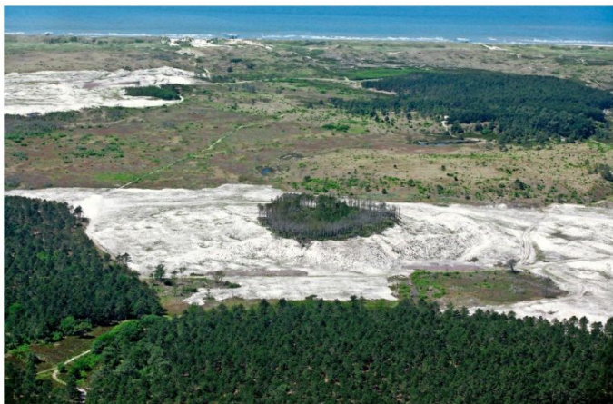
Luchtfoto van het duingebied bij Schoorl met de kale vlaktes na de branden.