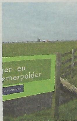
Harger- en Pettemer- polder

Het is de geschiedenis die je hier ziet, ruikt en voelt. Achter me de duinen van Schoorl, links de Hondsbossche Zeewering, en hier dan het land dat eeuwenlang onder water liep, land dat werd drooggemaakt en dat weer opnieuw overstroomde, land dat eigenlijk nooit definitief op zee werd gewonnen, want nog altijd is het water in deze polder brak.