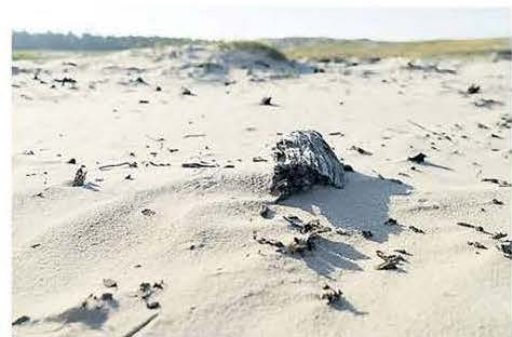
Stuifduinen oke, maar blijf van de dennen af, vindt de actiegroep.